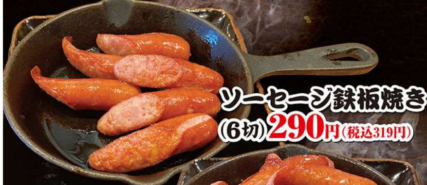
ソーセージ鉄板焼き (6切) 290円 (税込319円)