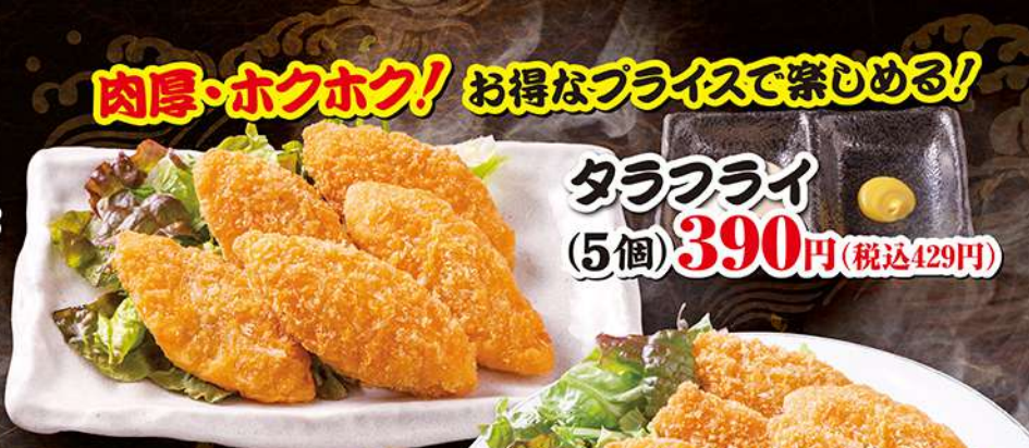
肉厚・ホクホク! お得なプライスで楽しむ! タラフライ (5個) 390円 (税込429円)