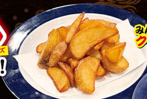
フライドポテト 390円(税込429円)