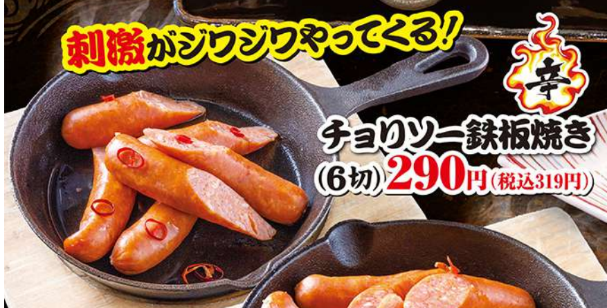
刺激がジワジワやってくる! 辛 チョリソー鉄板焼き (6切) 290円 (税込319円)