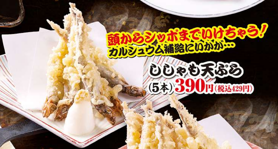
頭からシッポまでいけちゃろ! カルシウム補給にいいが… ひじりも天ぷら (5本) 390円 (税込429円)