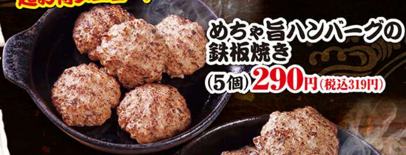
めちゃ旨ハンバーグの 鉄板焼き (5個) 290円 (税込319円)