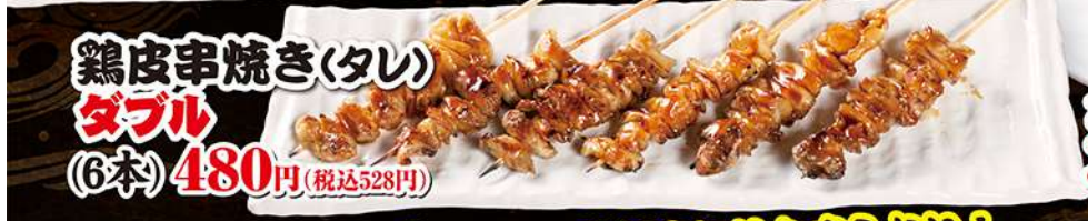
鶏皮串焼き(タレ) ダブル (6本) 480円 (税込528円)