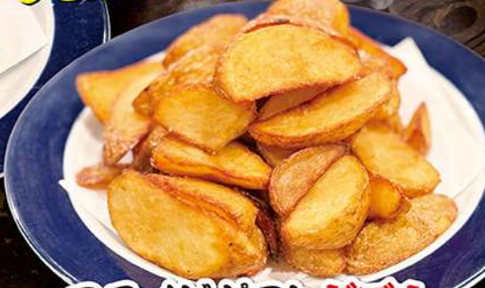
フライドポテトダブル 690円(税込759円)