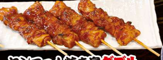
ヤンニョム焼き鳥 ダブル (4本) 480円 (税込528円)