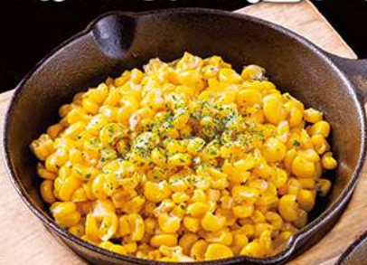
コーンバター 290円(税込319円)