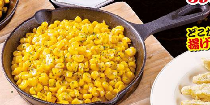
コーンバターダブル 480円(税込528円)