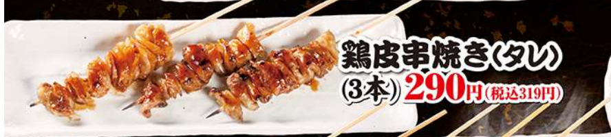
鶏皮串焼き(タレ) (3本) 290円 (税込319円)