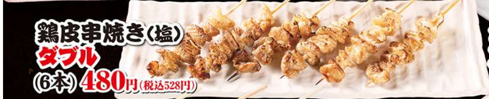
鶏皮串焼き(塩) ダブル (6本) 480円 (税込528円)