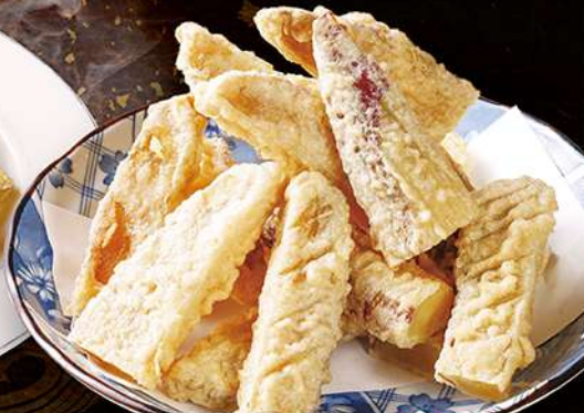
さつま芋天ぷらダブル 480円(税込528円)