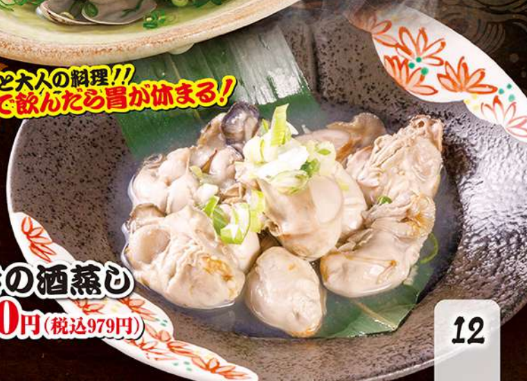
かきの酒蒸し 890円 (税込979円)