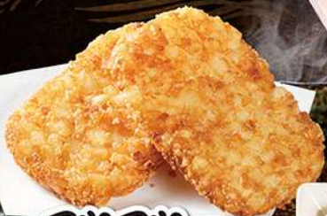
アツアツ ハッシュドポテト 290円(税込319円)