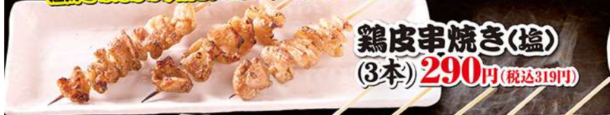
鶏皮串焼き(塩) (3本) 290円 (税込319円)