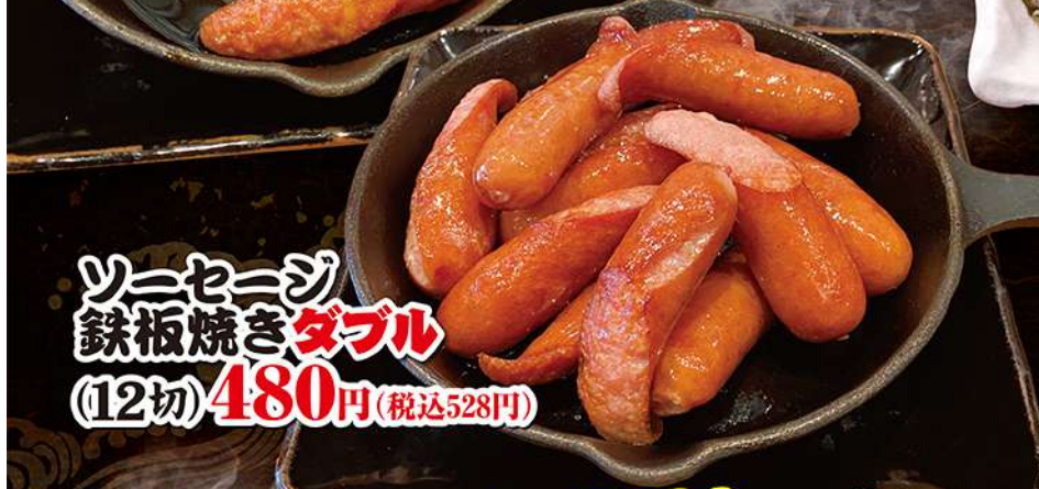
ソーセージ 鉄板焼き ダブル (12切) 480円 (税込528円)