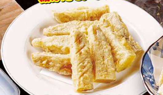
さつま芋天ぷら 290円(税込319円)