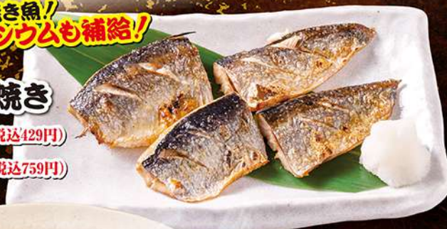
にひんの塩焼き (4切) 390円 (税込429円) (8切) 690円 (税込759円)