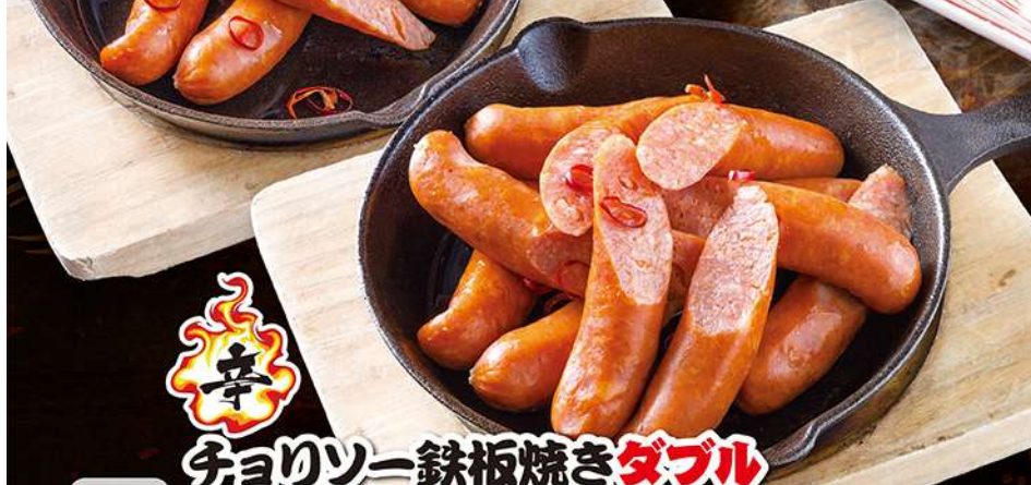
辛 チョリソー鉄板焼き ダブル (12切) 480円 (税込528円)