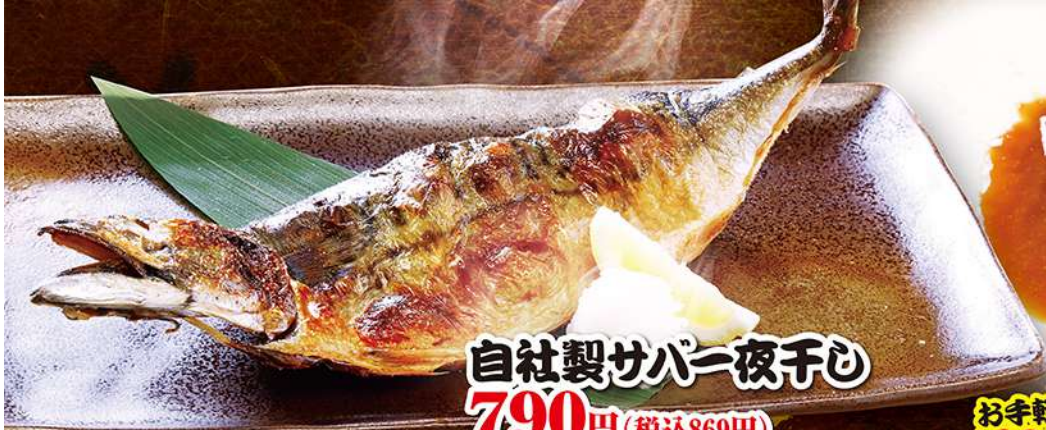
自社製サバ一夜干し 790円 (税込869円)