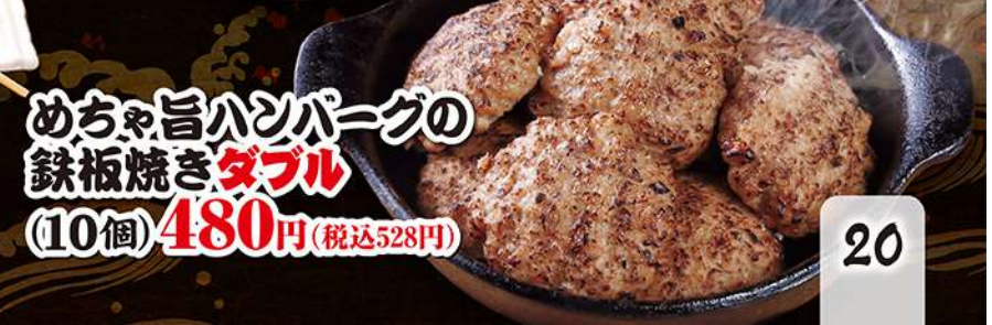
めちゃ旨ハンバーグの 鉄板焼き ダブル (10個) 480円 (税込528円)