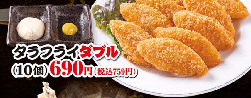
タラフライ ダブル (10個) 690円 (税込759円)