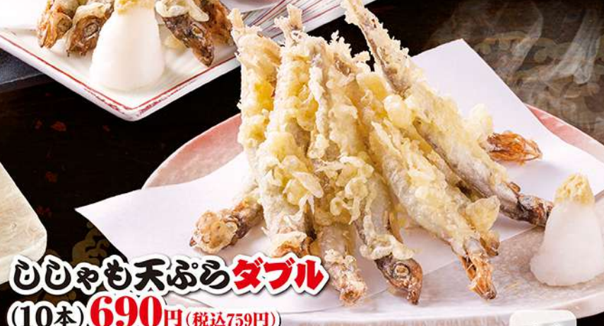
ひじりも天ぷら ダブル (10本) 690円 (税込759円)